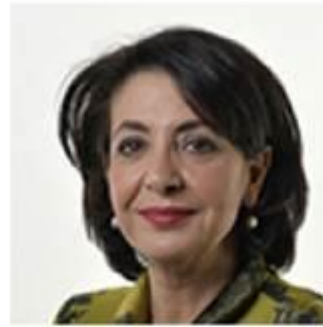
Khadija Arib PvdA Woonplaats Amsterdam Leeftijd 60 jaar k.arib@tweedekamer.nl