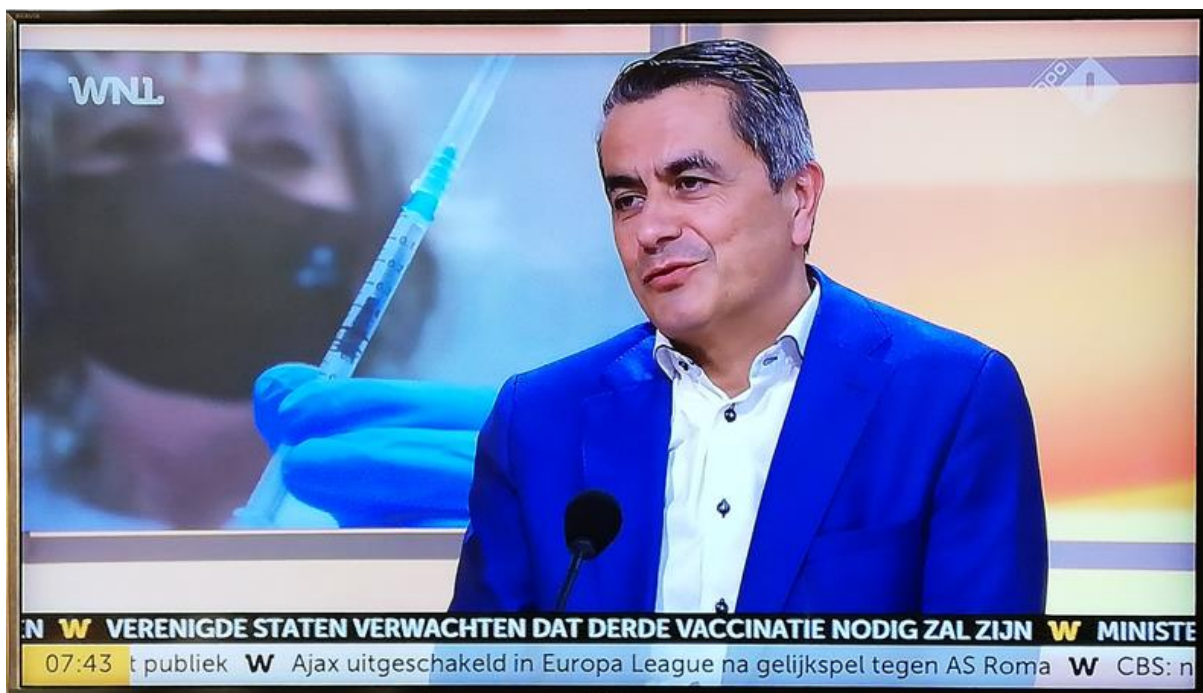
Van de USA: Op WNL van 16 april 2021 over de noodzaak voor een derde vaccinatie

De foto hierboven geeft de clou om ook in het Westen de zaak te normaliseren die past bij die in China. Nu weet ik dat geldschepping een oplossing biedt, zoals besproken in het " Ronde Tafelgesprek ". Maar dan blijft het 'n raadsel waar dat feitelijk gebeurt. Ik heb gehoord op de achterkant van Pluto . Er zijn meer onduidelijkheden in de politiek en massamedia die mij verontrusten, help mij a.u.b! Want welke journalist zal de Pulitzerprijs krijgen voor de oplossing van onze lockdown, avondklok en virusbesmetting? Vragen aan VNO-NCW hebben nog niet geleid tot bedrijfsherstel.