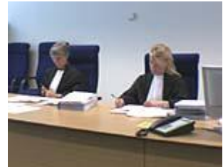
Zie hier een .wmv videoverslag (bron: sdn.nl).