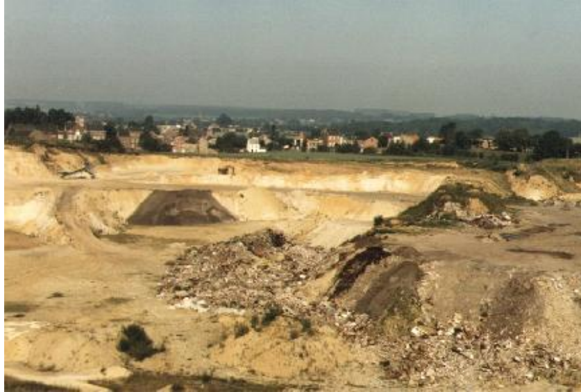
Put I - Sablières du Locray (grootte 11.88.08)