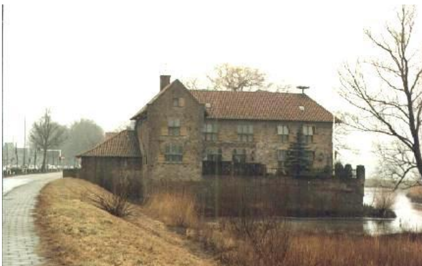
Het Bastion, ook wel Het kasteeltje, kantoor van Merks