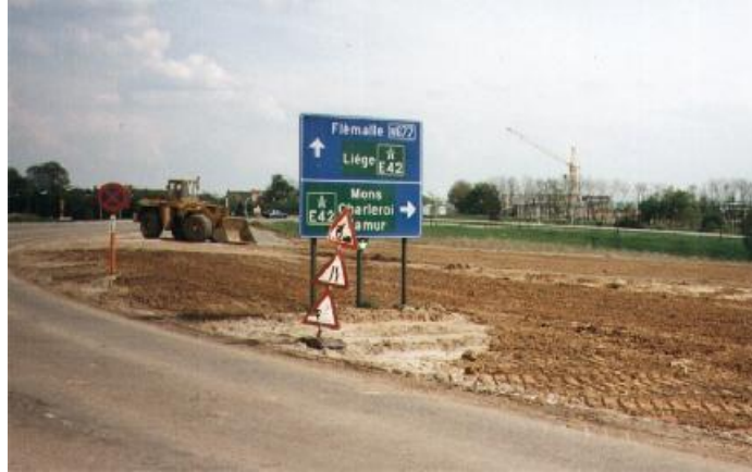
Put II Lemaire et Fils (grootte 4.27.83)