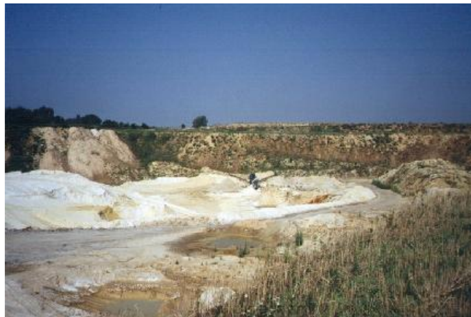
Put III Rossart (ook wel Locray 2) (grootte 17.24.07)