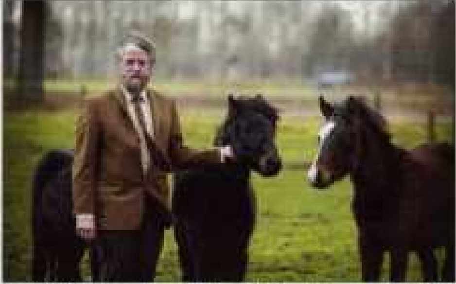
Bestuur van de Maas van de gemeente... in het... van de gemeente.

De afdeling Bestuur en Financiën is verantwoordelijk voor de uitvoering van de bestuursplannen en het toezicht op de uitvoering van de bestuursplannen. De afdeling is verantwoordelijk voor de uitvoering van de bestuursplannen en het toezicht op de uitvoering van de bestuursplannen.