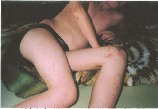
OVER Het hele LICHAAM ARSENICUM, VERGIFTIGING. MANGAAN VERGIFTIGING.