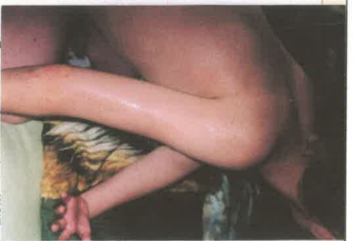
RUG / BILLEN / KNIJEN / EDELLEN / HUID SCHOUDEK / HOUTS - ENKELS