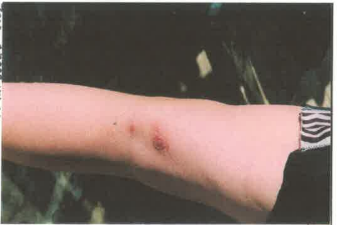
Zoon = 3 Jarak vol Ptasenicum / Apitum ONGER DE EDEEN / BULLEN / HUID ERTEEN .