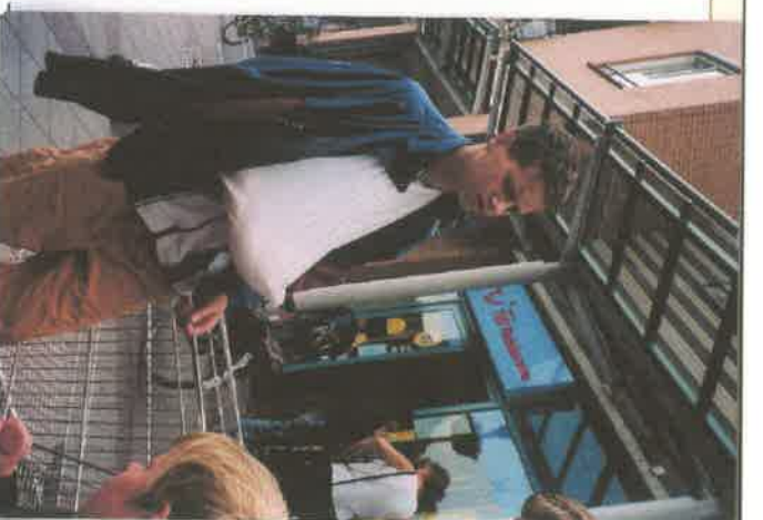
GEHEUGEN - LEER/WINCEN TRARTE SPOR NISSEN - KUNNEN DE VADER WORDEN