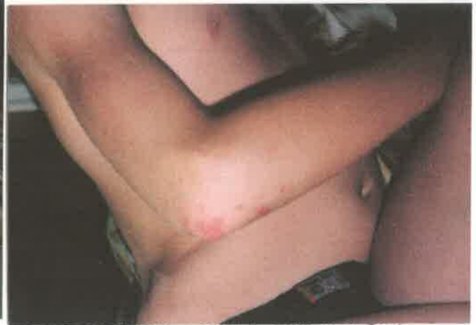
ZWARE METALEN + CHROMIUM VERGIFTIGING. OPLOS/MIDDELEN/CHEMIE.