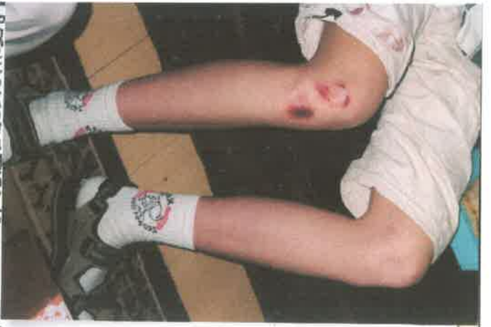
BESCHADIGDE JEUIG/GESTOLEN TOEKOMST