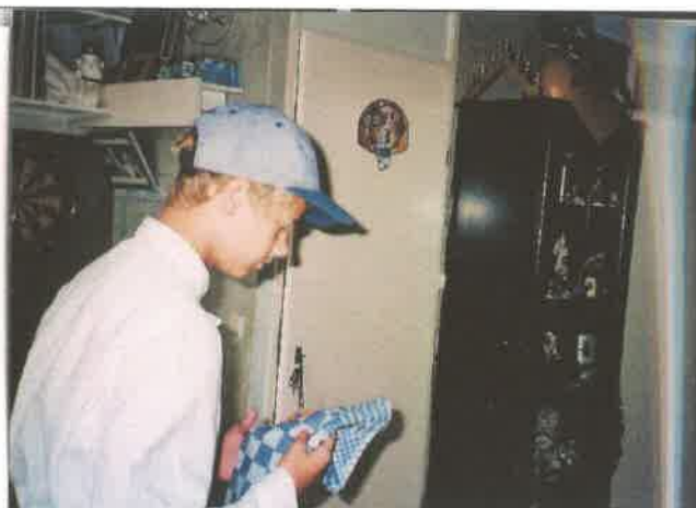
LEERSTUDIE MISLUKT, SMAAK-GEUR HERSEN STOORNISSEN BOT BREUKEN - WEG EN OMVALLEN. COMA IS ZIEK.