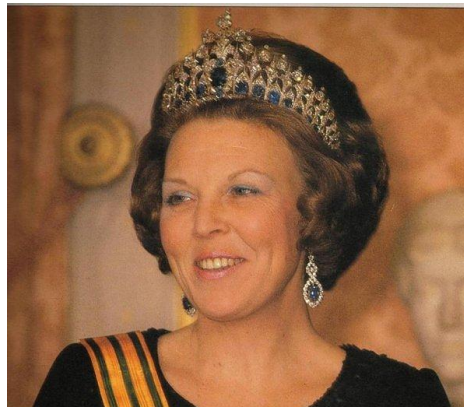
Kneuterdijk 22, 2514 EN Den Haag

Aan Hare Majesteit de Koningin Beatrix als Voorzitter van de Raad van State