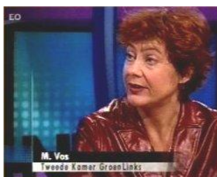
Vos zwijgt over kennis

Wat de rampzalige gevolgen zijn van deze opzettelijke in stand gehouden valse etikettering kunt u zien in bijgevoegde 2Vandaag-uitzending ( http://www.mstsnl.net/video/wolmanzouten-2.wmv ) over de drie containers die overboord sloegen op zondag 23 dec 2003 vanaf het schip Andinet ten noordwesten van Texel.